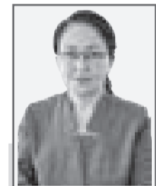
Эльмира РАУЯСОВА, председатель Курчатовского городского суда Восточно-Казахстанской области

С 1 июля 2021 года введен в действие Административный процессуально-процессуальный кодекс, который регулирует отношения, связанные с осуществлением внутренних административных процедур государственных органов, административных процедур, а также порядок административного судопроизводства.