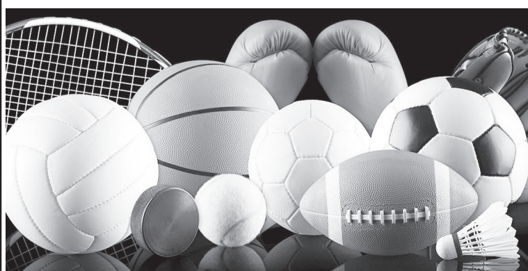
Спортқа бөлінген қаржының қайтарымы болу керек