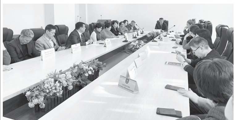
Заң үстемдігі – демократияның ең биік шыңы