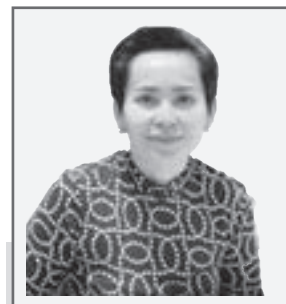
Айгуль КОЙШИБАЕВА, судья Специализированного межрайонного экономического суда г. Алматы

С 1 июля 2021 года вступает в силу Административный процедурно-процессуальный кодекс РК (АППК). Институт административной юстиции является кардинально новым проектом, реализуемым в Казахстане. Принятие нового кодекса подразумевает создание нового вида судопроизводства - административного.