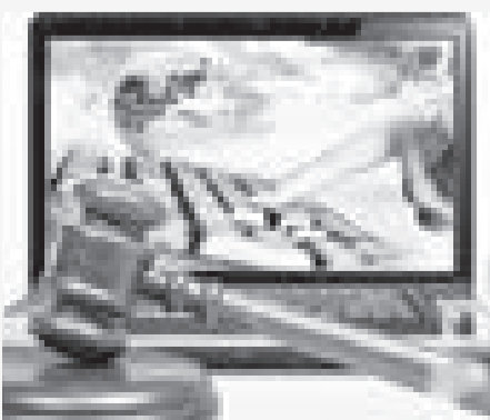
Кейіннен «Электронды шақыру қағазы», «Сот құжаттарымен танысу», «SMS-хабарлама» сервисі, «Талдау» форумы секілді

Жаңа технология кез келген саланың жұмысына жан бітіріп, қызметін жеңілдеткені сөзсіз. Әсіресе электрондық жаңашылдықтар сот саласының тынысын ашқаны шындық. Сот тәжірибесіне ең алдымен «Төрелік» ақпараттық жүйесі, «Сот кабинеті» сервисі енгізілгені есімде.