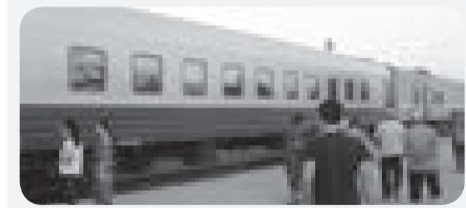
«Алматы 1» станциясы ЖІПБ баспасөз қызметі

Құқық бұзушылықты ескерту, жолын кесу маңызды. Әсіресе, қоғамдық орындарда ортақ тәртіпті сақтау бұлжымас міндет. Осыған орай «Алматы 1» станциясында қауіпсіздікті қамтамасыз ету мақсатында тиісті шаралар тұрақты қолға алынуда. Жақында Желілік полиция басқармасының мұрындық болуымен өткен «Көліктегі қауіпсіздік» акциясы сол ауқымды шараның бір парасы.