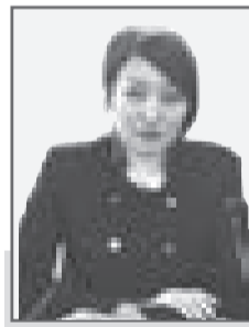
Рсалды КАКИШЕВА, судья Специализированного межрайонного административного суда Восточно-Казахстанской области

Целью нового вида судопроизводства обозначено обеспечение посредством активного содействия суда равенства сторон в спорах между частными лицами и административными органами.