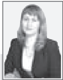
Инна КАРКАДА, Судья Павлодарского областного суда

Динамичное экономическое развитие, появление новых форм и способов взаимодействия субъектов рыночной экономики и предпринимательства требуют обеспечения гарантий добросовестной конкуренции и эффективной защиты от неправомерных действий.